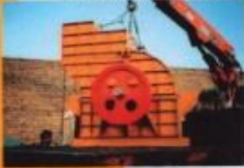
سنگ شکن (Hammer mill)